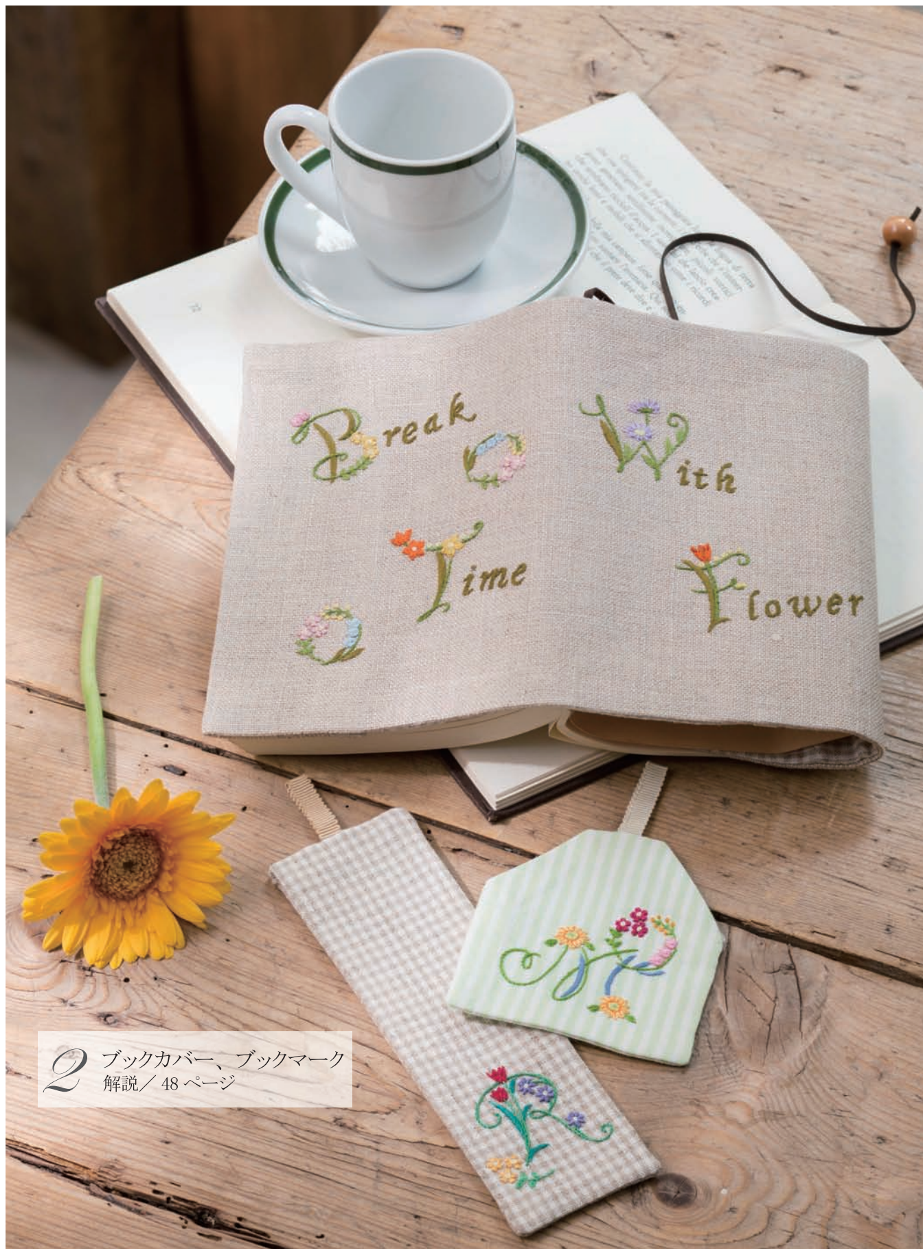
2 ブックカバー、ブックマーク 解説 / 48 ページ